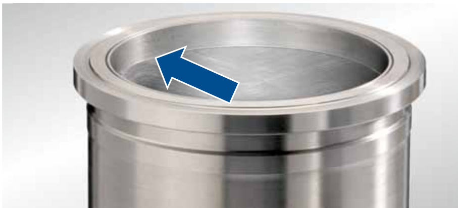
Fig. 1 Chemise de cylindre Actros

Informations supplémentaires Malgré l'assise relativement stable des chemises de cylindre dans l'alésage de base, des mouvements microscopiques sont générés par la pression de combustion et les forces latérales de piston. Après une durée de fonctionnement prolongée, ces mouvements provoquent l'enfoncement de la collerette de la chemise dans le carter moteur. Les modifications constructives servent à réduire l'usure du moteur. Ceci est le seul moyen permettant de garantir le kilométrage supérieur à un million de kilomètres exigé pour les véhicules utilitaires.