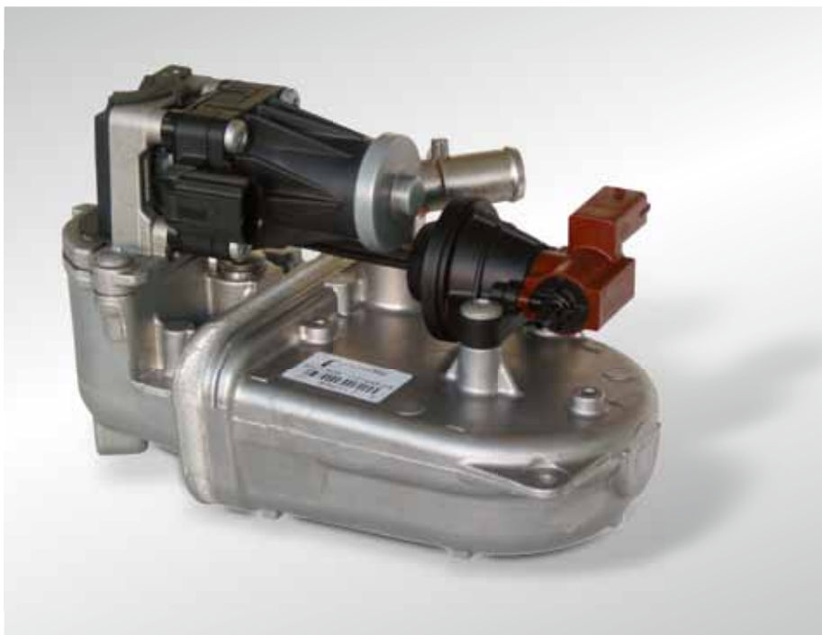
Rys. 3: moduł chłodzący PIERBURG EGR ze zintegrowanym zaworem EGR i klapką obejściową, montowany przez Fiata i GM