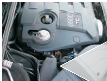
Ejemplo: cargador VTG y EPW (resaltado a color rojo) en el Audi A4 TDI