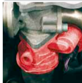
La mariposa de r gula de cerca (resaltada en rojo)

Al parar el motor, la mariposa de r gula se cierra prematuramente evit ndose de esta forma una "sacudida de desconmutaci n".