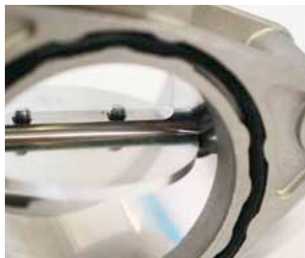
Mariposa de r gula nueva