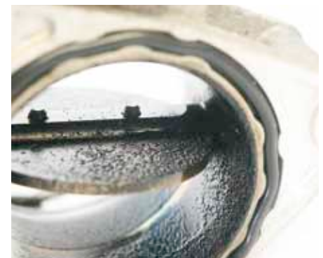
Mariposa de r gula en estado aceitado