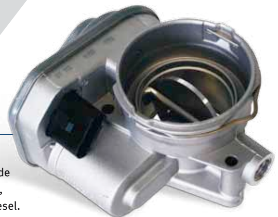
Vista del producto Mariposa de r gula

1) En la pr ctica existen diferentes designaciones para la mariposas de r gula, p. ej., v lvula de mariposa, mariposa diesel, pre-mariposa diesel. La designaci n de VOLKSWAGEN reza "Mariposa del tubo de aspiraci n".