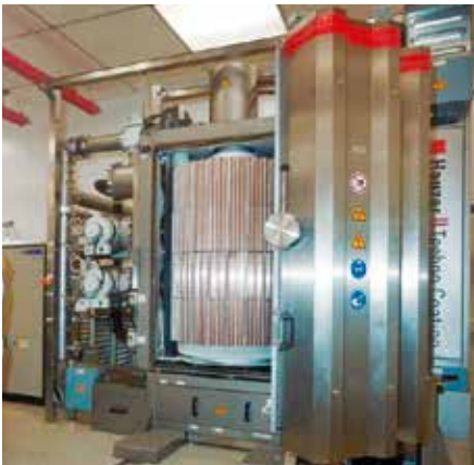
Fig. 3 Instalação sputter