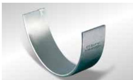
Fig. 1 Bronzina sputter KS

As bronzinas sputter foram lançadas na construção moderna de motores em 1989. A técnica galvânica de revestimento da superfície de deslizamento se revelou limitada face ao lançamento dos novos motores diesel de potência e torque muito elevados que implicavam uma crescente carga específica no rolamento. Por este motivo foram analisados e desenvolvidos novos materiais de bronzina, bem como novos processos de revestimento. Bastou modificar o processo de revestimento das bronzinas, que passaram a ser revestidas segundo o método sputter, para obter uma robustez das bronzinas até 50 % superior e uma resistência ao desgaste muito maior sem alterar as dimensões e o material usados.