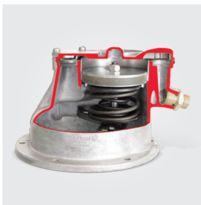
Uma bomba de vácuo com pistão clássica (modelo de corte)

Uso subsequente de uma bomba de vácuo usada em um motor reparado: as bombas de vácuo estão ligadas ao motor e, consoante o modelo, são conectadas ao circuito de óleo do motor. Após um dano no motor pode acontecer que: