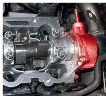
Bomba de vácuo e eixo de comando em Opel Vectra B (em destaque)