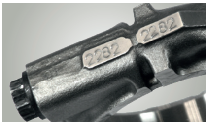
Numere de împerechere

Pentru a evita confuziile, tijele bielelor și capacele de lagăr aferente sunt marcate de regulă cu numere de împerechere identice.