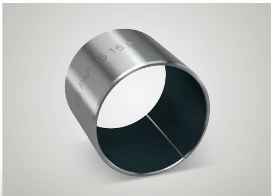
KS PERMAGLIDE® P10 Gleitlager-Buchse