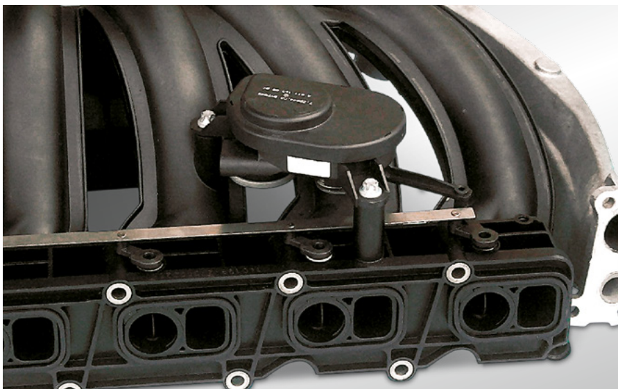
Fig. 41 Collecteur d'aspiration avec clapets « Tumble » et EAM-i

Sur les nouvelles applications, le réglage du ralenti et le maintien du démarrage sont assurés par le réglage du papillon. Celui-ci est à commande à moteur électrique. Ce procédé est plus rapide, permet des passages d'air plus réduits pour le ralenti et autorise un réglage du papillon sans liaison mécanique à la pédale d'accélérateur (accélération électrique ou électronique).