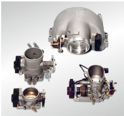
Fig. 42 Différents boîtiers papillon

De manière à ce que le mélange air-carburant d'un moteur CDI brûle rapidement et correctement, l'air est aspiré par deux canaux d'aspiration séparés à torsion pour chaque piston. Chacun de ces canaux d'aspiration est équipé d'un clapet de réglage à torsion (« clapet Tumble ») actionné par une tige du EAM-i (module d'entraînement électrique avec « intelligence » intégrée).