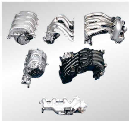
Fig. 43 Différents types de conduites d'aspiration