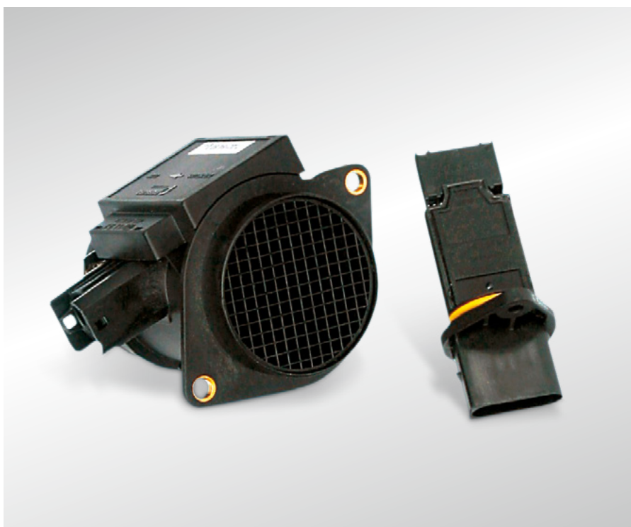
Fig. 40 Différents types de débitmètre d'air massique

Vous trouverez plus d'informations dans nos Service Information.