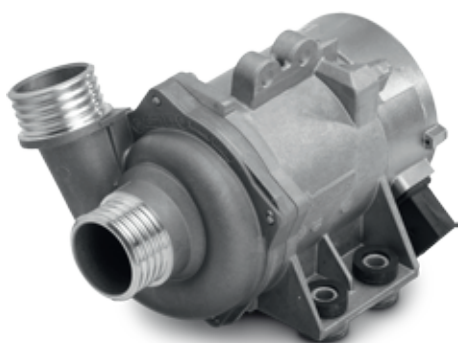
Vista del producto CWA 200 (original)

Hemos detectado falsificaciones del producto bomba de refrigerante eléctrica CWA 200.