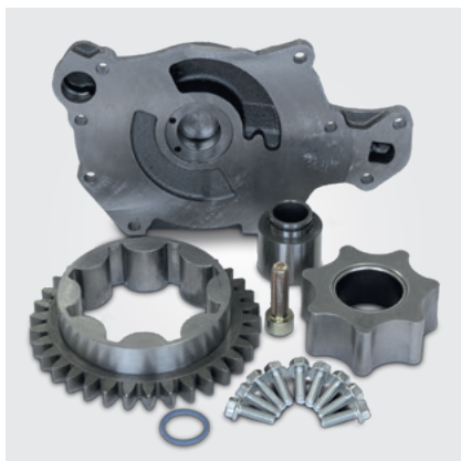
商品编号 20 1402 20660