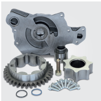
商品编号 20 1402 26761