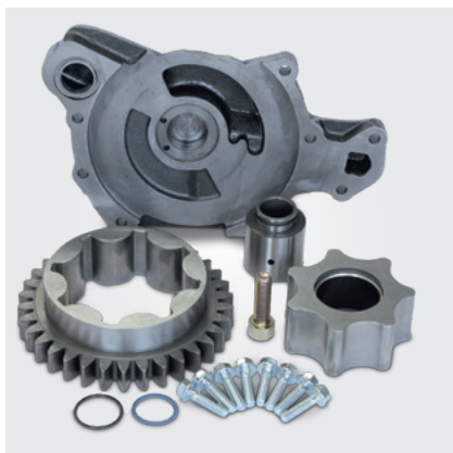
商品编号 20 1402 26760