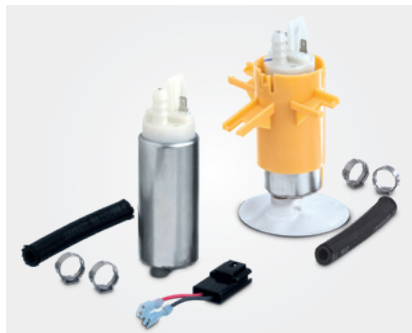
如有需要，可与替换件套装一并提供必要辅助工具