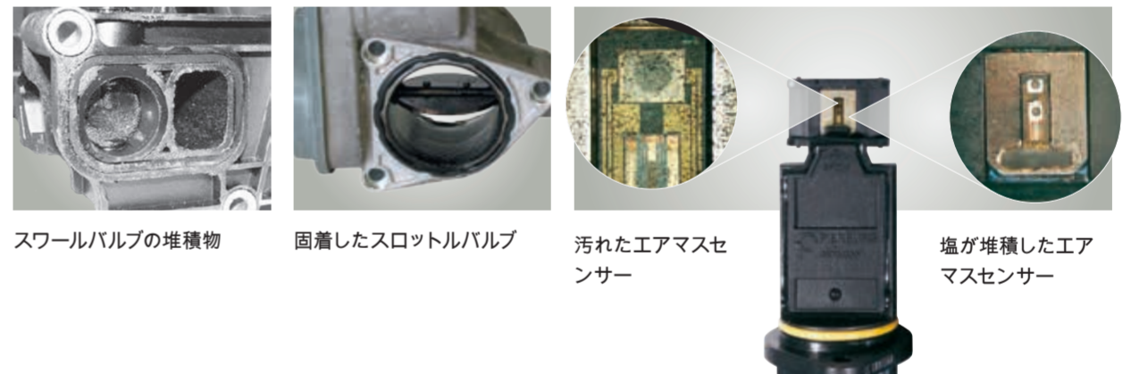
スワールバルブの堆積物 固着したスロットルバルブ 汚れたエアマスセンサー 塩が堆積したエアマスセンサー