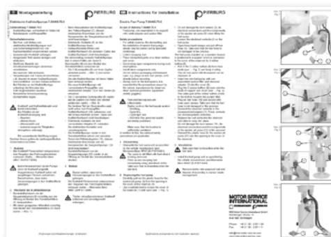
Простая замена наглядно описана в руководстве по монтажу (прилагается к насосу).

Сохраняем за собой право на внесение изменений и на отклонения в иллюстрациях. Назначение и замену см. действующие каталоги, компакт-диски TecDoc или же системы, базирующиеся на данных TecDoc. * Номера деталей приведены только для сравнения, их нельзя указывать в счетах для конечных потребителей.