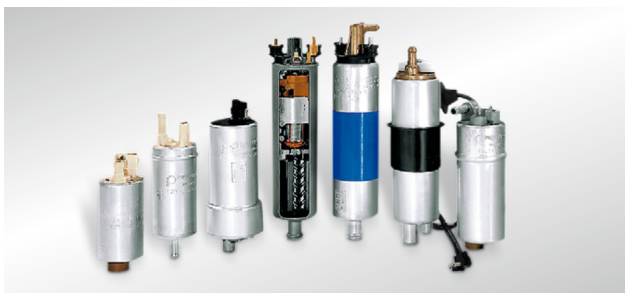
Рис. 14 Топливные насосы и узлы подачи топлива, различные исполнения

Для эксплуатации транспортных средств и машин с двигателями внутреннего сгорания (ДВС) обычно требуется бензин или дизельное топливо. Применяемые здесь детали обобщаются под понятием «топливная система».