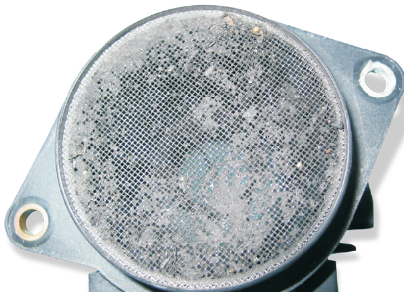
Засорение датчика расхода воздуха