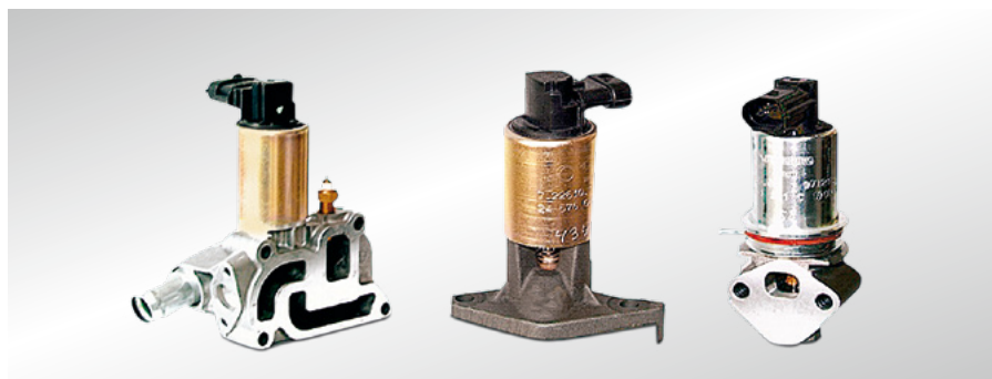
Рис. 35 Клапаны системы EGR для бензиновых двигателей