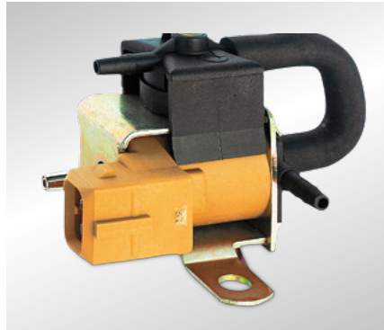
Рис. 36 Электрический преобразователь давления (EDW)

Электрические клапаны системы EGR (EAGR) и некоторые механические клапаны