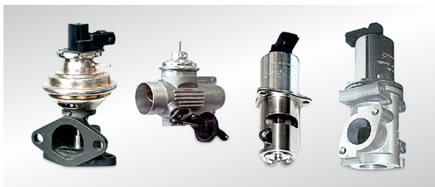
Рис. 34 Клапаны системы EGR в случаях применения дизеля