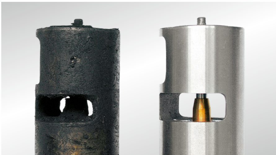
Рис. 38 Клапан системы EGR (дизель) с сильными отложениями и в новом состоянии