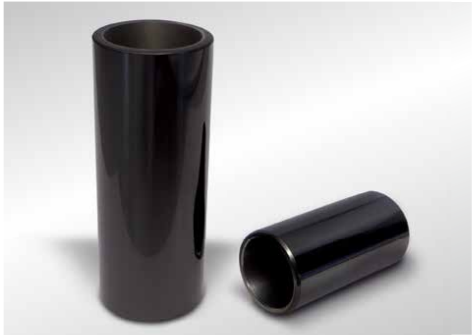
Рис. 1: Поршневые пальцы с покрытием DLC

Покрытие DLC отличается чрезвычайно твердой поверхностью, которая значительно превосходит по степени твердости высокозакаленные стали. Кроме того, покрытия DLC очень эластичны и способны в реверсивном (обратимом) порядке воспринимать деформирующие нагрузки. Толщина слоя составляет до 2 мкм при чрезвычайно низком коэффициенте трения скольжения, равном 0,1. Максимально допустимая температура детали составляет ок. 450 °C.