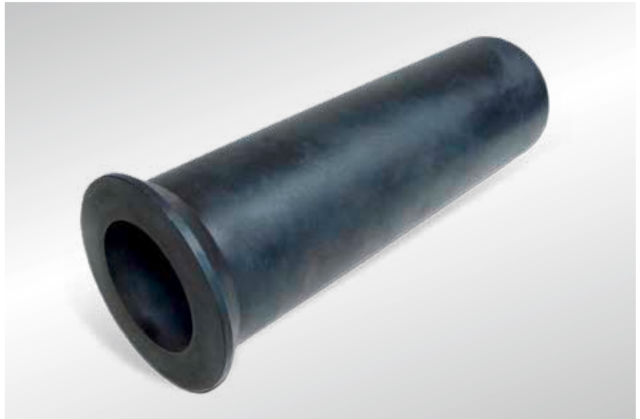
Изобр. 1: Заготовка цилиндра