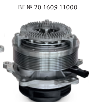
BF № 20 1609 11000