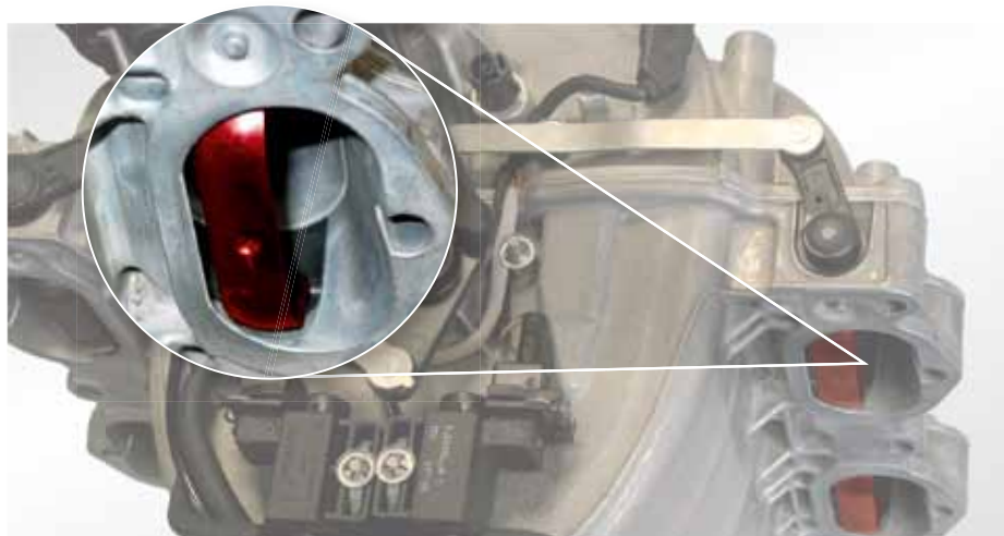
Перекидные заслонки (выделены красным цветом) во впускной трубе PIERBURG, например, в Mercedes E-класса 500