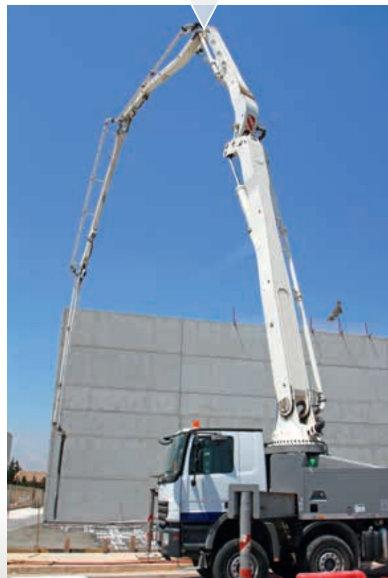
Masz rozdzielczy do betonu