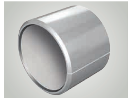
Tuleja łożyska ślizgowego KS PERMAGLIDE® P14

Również łożyska iglicowe można w ramach tych aplikacji zastąpić tulejami łożysk ślizgowych KS PERMAGLIDE®. Tuleje łożysk ślizgowych KS PERMAGLIDE® są w porównaniu z łożyskami iglicowymi tanie i kompaktowe.