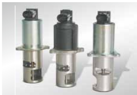
Vista do produto (excerto)