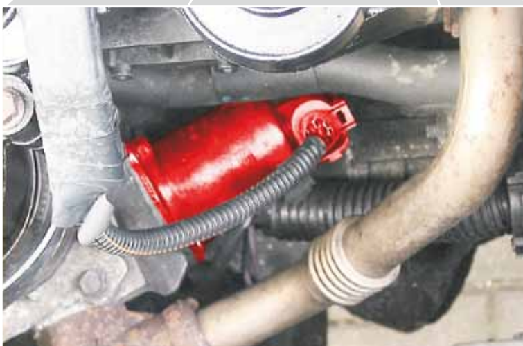
Válvula EGR no Renault Master JD1M (em destaque)