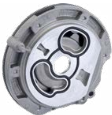
Pompa olio cambio Volvo "I-Shift"