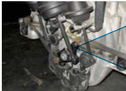
Schadensbild: Bruch am Schaltgestänge