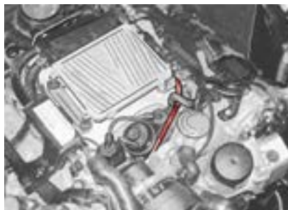
Motorraum W211 mit Leitung der Motorentlüftung (hervorgehoben)