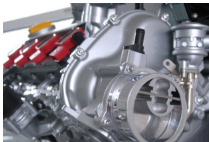
Hochleistungsvakuumpumpe neuester Generation