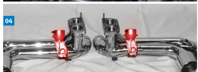
01–04 Eine Vielzahl von Bauteilen benötigt Unterdruck