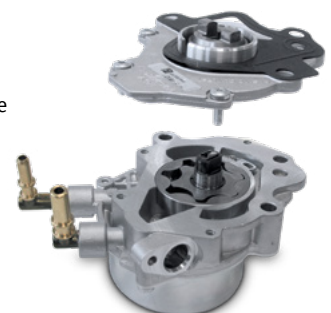
06 Tandempumpe: kombinierte Öl-/Vakuumpumpe