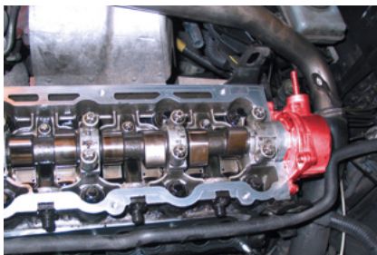
Stand der Technik sind Einflügel-Vakuumpumpen, die von der Nockenwelle angetrieben werden.

Der Systemlieferant Pierburg ist führender OE-Hersteller von Vakuumpumpen für die internationale Automobilindustrie. Als Erstausrüster verfügt Pierburg über eine jahrzehntelange Kompetenz in der Entwicklung und Fertigung und hat durch innovative Konzepte maßgeblich zum „Stand der Technik“ beigetragen.