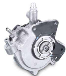
05 Tandempumpe: kombinierte Kraftstoff-/Vakuumpumpe